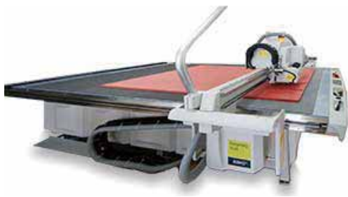
5×10板対応のマルチカット XL24 約40種類の素材に対応致します。

新たに、2機種の導入を致します、従来の加工に加えて更なる技術向上と品質向上を目指して従業員一同、もの作りに寄与する気持ちで皆様のご要望に応えようと頑張る所存です。尚 URL 及びメールアドレスには変更ございません。