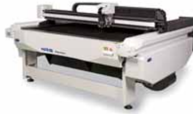
高品質アイスメルトカット 大型レーザー Sei XY NRG