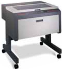
繊細な彫刻が自慢の V-460