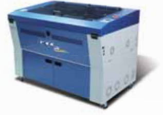
ハイスペックレーザー LaserPro SPIRIT GLS