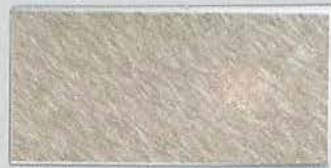
ステンレスランダムHL/ST-19