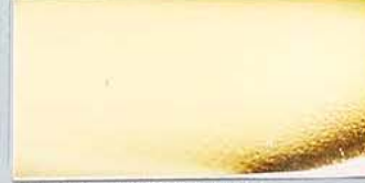
ステンレス鏡面金メッキ