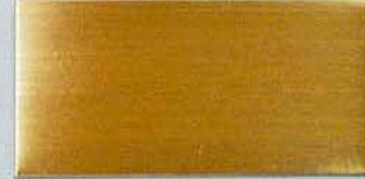
ステンレスHL金メッキ