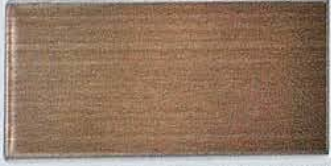
カラーステンレスブロンズHL/SP-17