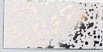
ステンレスメーカー梨地/ST-4 (板厚1.5t限定)