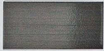
しゃく銅ブロンズ/CU-10