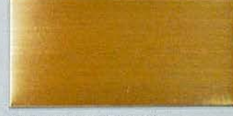
ステンレスHL金メッキ