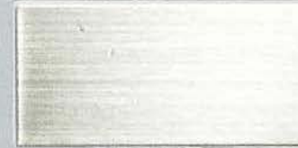
真鍮ホワイトブロンズ/BS-8