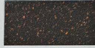
ステンレスサビ風塗装