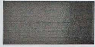
しゃく銅ブロンズ/CU-10