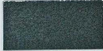
ステンレス緑青色梨地