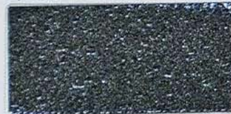
ステンレス梨地黒