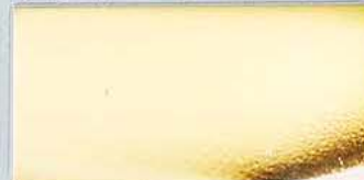
ステンレス鏡面金メッキ