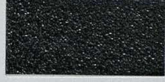
真鍮硫化いぶし梨地/BS-11