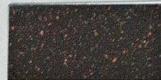
ステンレスサビ風塗装