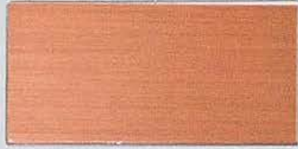
しゃく銅ブロンズ/CU-95