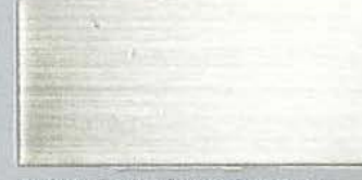
真鍮ホワイトブロンズ/BS-8